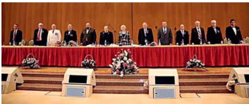
Президиум Общего собрания РАЕН, посвященного 25-летию Академии.

Верю в то, что бренд РАЕН как особый МЕМ сохранится на долгие десятилетия.