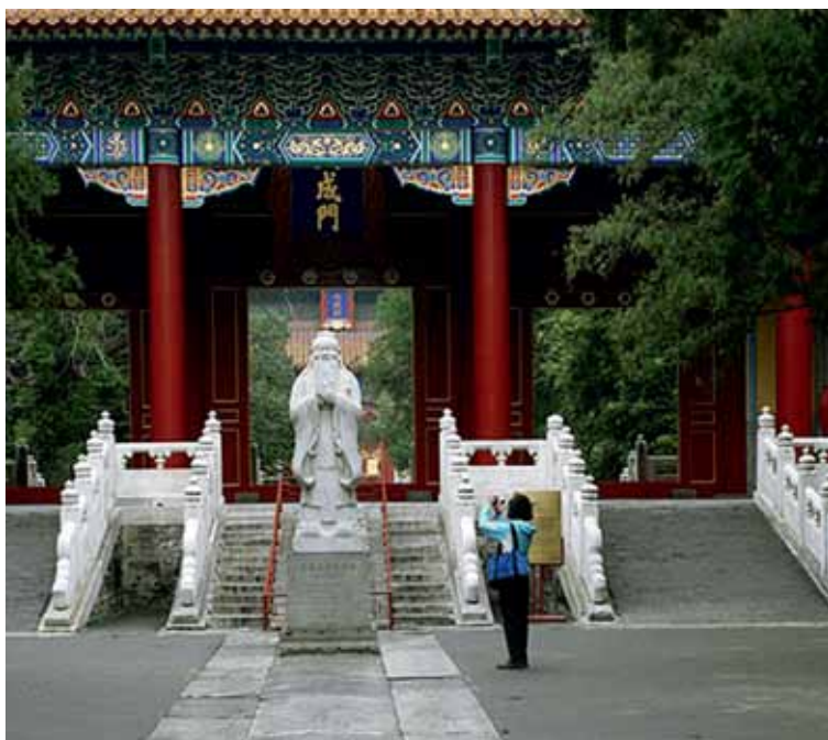
Памятник Конфуцию в столичном храме.

Большое значение придается традиционным ценностям. Следует обратить внимание на названия подразделов – пятый называется «Взять судьбу нации в свои руки и быть гордым китайцем», а шестой – «Конфуций - «учитель десяти тысяч поколений». Характерно и такое название: «Китайская мечта» не подчиняется «общечеловеческим ценностям».