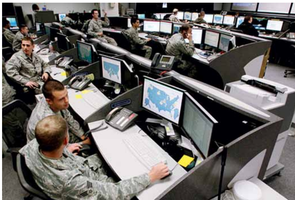
Кибервойска США активно действуют в социальных сетях.

Будущее будет принадлежать тем, кто сумеет защитить свои национальные интересы в киберпространстве.