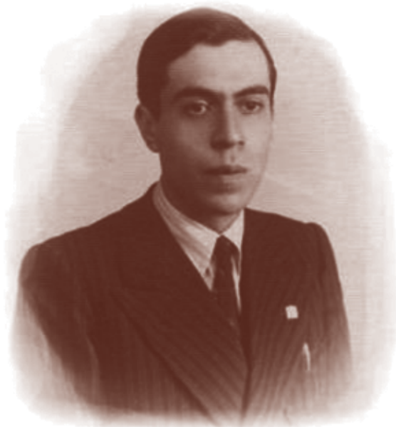
Итальянский физик Этторе Майорана.

Несмотря на огромный интерес к этим частицам, за весь остаток минувшего столетия так и не удалось найти фермионы Майораны или их виртуальные подобию, так называемые квазичастицы . Первый прорыв в поисках «частицы-януса» произошел только в 2001 году, когда российско-американский физик Алексей Китаев понял, что виртуальные фермионы Майораны могут возникать на