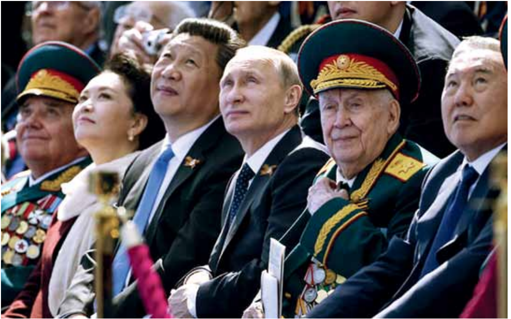
Руководители России и Китая на Параде Победы в Москве 9 мая 2015 года.