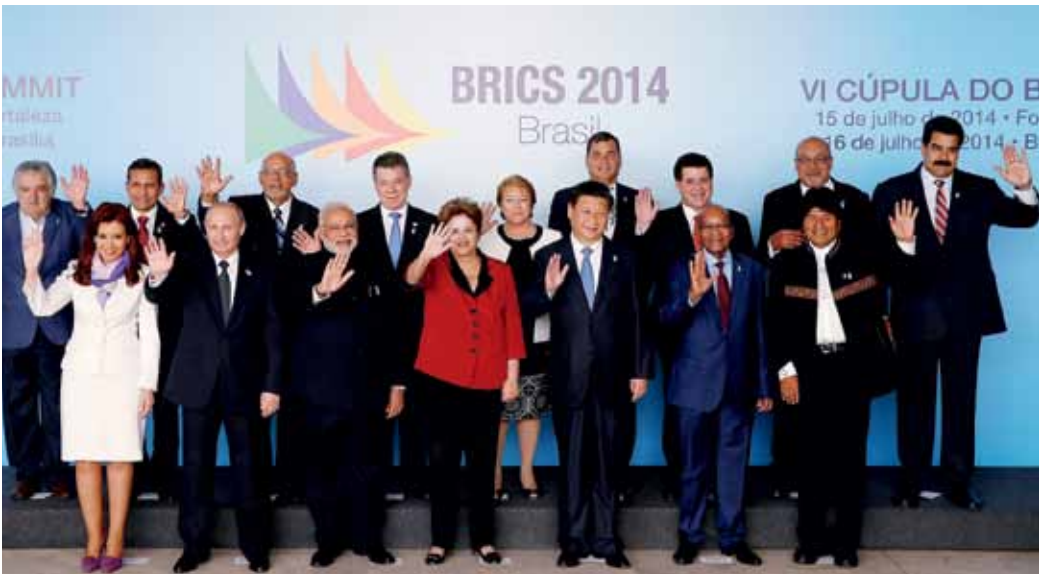
В конце раздела помещено фото участников саммита БРИКС 2014 года.

Большое значение имеют проекты евразийской интеграции, строящиеся «исключительно на добровольных началах, исходя из общих интересов» – так работа-