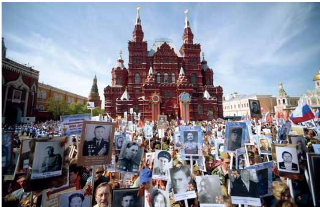
Марш «Бессмертного полка» в Москве 9 мая 2015 г.

чение этого события для дальнейшего развития России и ее положения в мировом сообществе трудно переоценить.