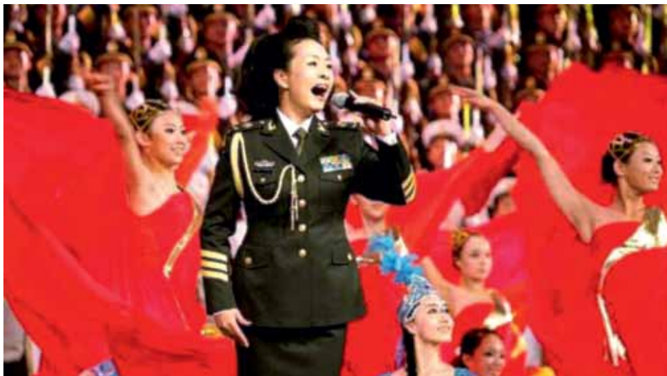
«Самый звонкий голос Китая» звучал с разных сцен страны и мира.