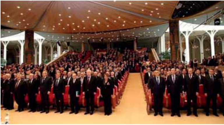
Открытие Общего собрания Российской академии естественных наук. Москва, 24 декабря 2014 г., Храм Христа Спасителя.

рой реализуется синтез естественных, технологических и гуманитарных знаний. Но главное – мы сегодня являемся свидетелями и участниками нового синтеза – «научного знания» и «веры». Наука и религия – два независимых канала, которые приводят к более целостному пониманию мира. И здесь огромную роль играют общественные институты.