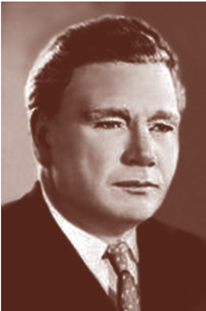
Русский естествоиспытатель, психолог и философ П.К. Анохин.

Во-первых, определенную роль в этой процедуре специализации, по-видимому, играют процессы отражения . Однако известно, что разные виды взаимодействия различных дискретностей проявляют многообразие результатов отражения. Почему один вид физико-химического взаимодействия запечатлевается в дискретностях (либо в одном объекте, либо в обоих объектах, либо во всех участниках взаимодействия), а в иных случаях следы отражения (знаки, сигналы) не имеют места? Было бы полезно подвергнуть подобному семантическому анализу характер и способы всех классов взаимодействий, существующих в мире, начиная с фундаментальных взаимодействий.